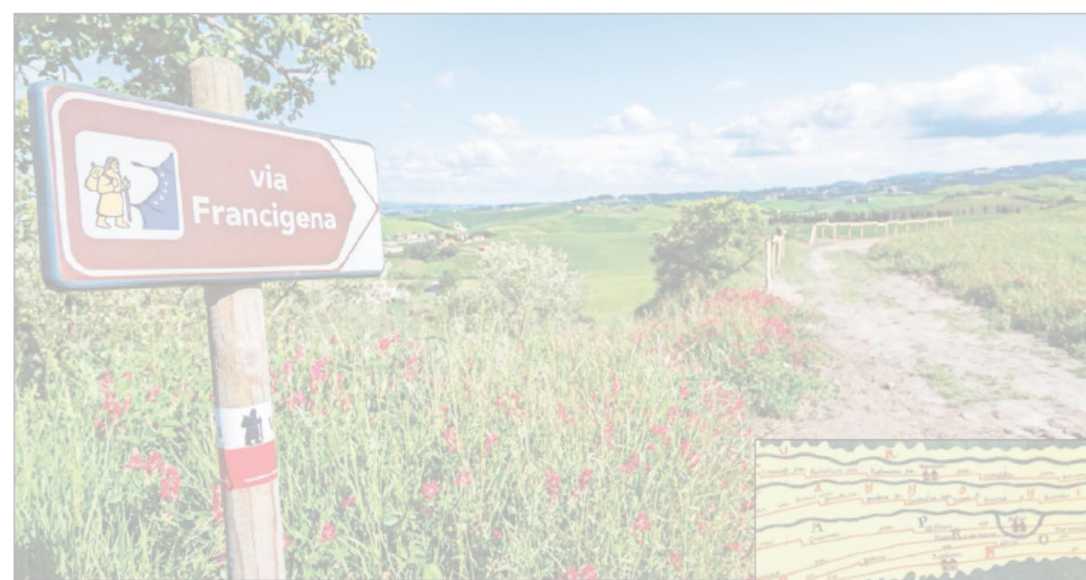
Un tratto italiano della via Francigena; a destra: un'antica mappa medievale

Per tutta l'estate si potranno vivere così momenti di «Hope&Pray», cioè occasioni per ascoltare e meditare la Parola di Dio; fare esperienza di pellegrinaggio nell'ambito di «Hope&Walk»; scoprire, grazie alle attività di «Hope&Place», luoghi nuovi, recuperando il valore dello stupore e della bellezza; rileggere la propria storia e l'attuale situazione pandemica attraverso l'arte, la letteratura, la musica e il teatro nelle comici dei monasteri e dei conventi che apriranno le loro porte per «Hope&Welcome». Numerose, infine, le tappe del Giro d'Italia della speranza, organizzato all'interno di «Hope&Play», che vedrà protagoniste le associazioni e le società sportive e durante il quale una fiaccola percorrerà le vie delle città portando un messaggio di rinascita.